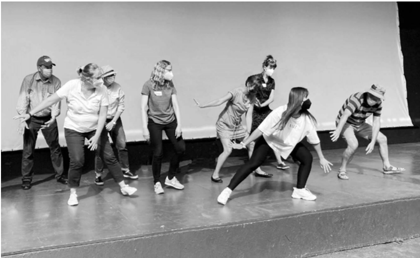
Abb. 1: Flock of Sheep

In Abbildung 1 sind Teilnehmer:innen der Gruppe bei der Übung „Flock of Sheep“ zu sehen, in der eine Gruppe ähnlich einer Tierherde mit fliegendem Führungswechsel einer Person in ihren Bewegungen folgt. Abbildung 2 zeigt die Übung „Monument“, bei der die Teilnehmer:innen ohne zu sprechen nach und nach ihren Platz in einer lebenden Skulptur wählen, dabei die kollektive Skulptur verändern