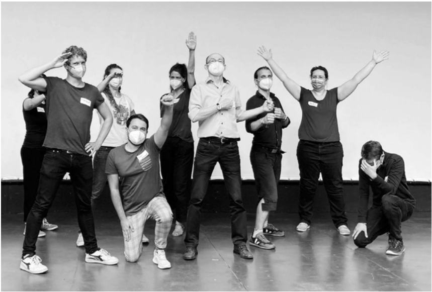
Abb. 2: Monument

und letztlich gemeinsam ein Thema (hier: „Held:innen“) verkörpern.